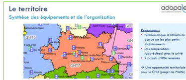
Etat des lieux des équipements sur le GHT